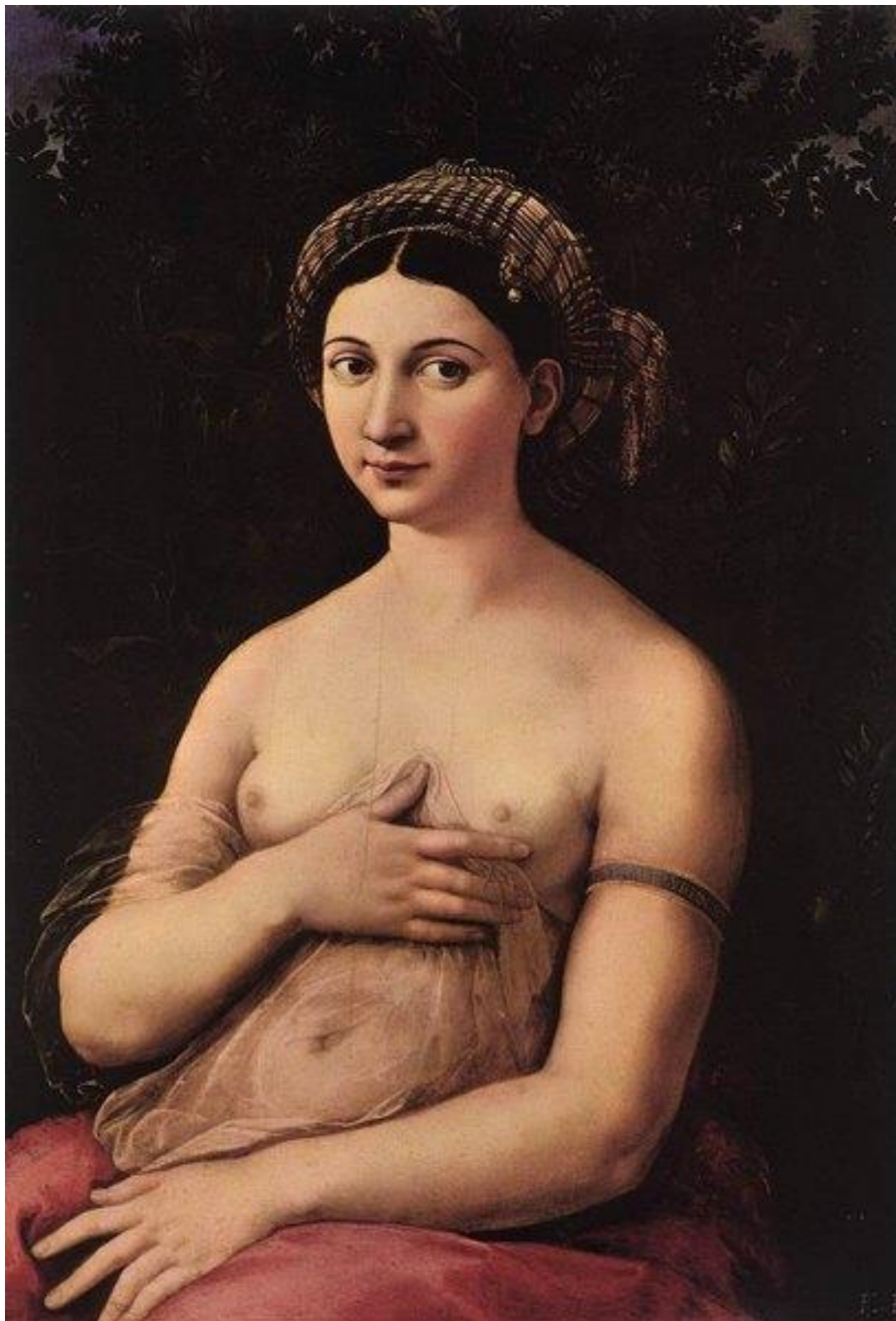
La Fornarina - Œuvre de Raffaello Sanzio (dit Raphaël) - 1518

Palper un sein.. Ça ne date pas d'hier.. Le radiographe, ça c'est récent !