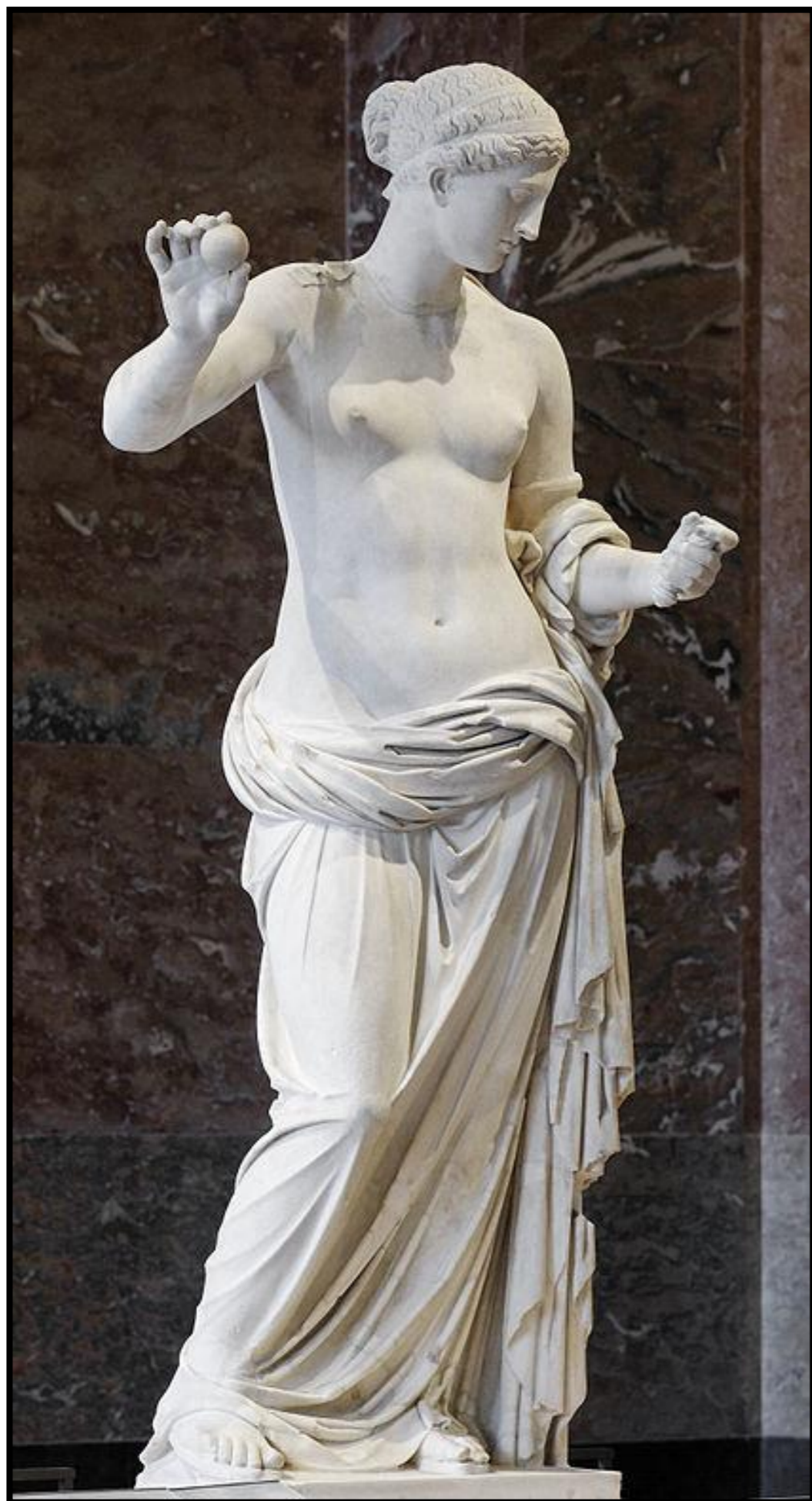
La Vénus d'Arles - Copie Romaine d'une sculpture de la Grèce Antique